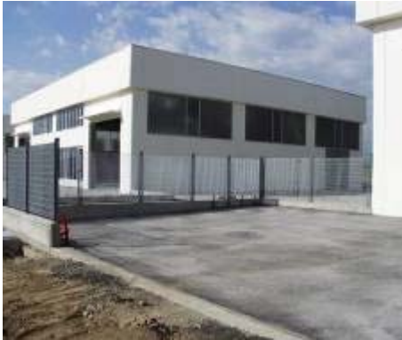
Capannoni artigianali e industriali, siti in Scalenghe (TO)