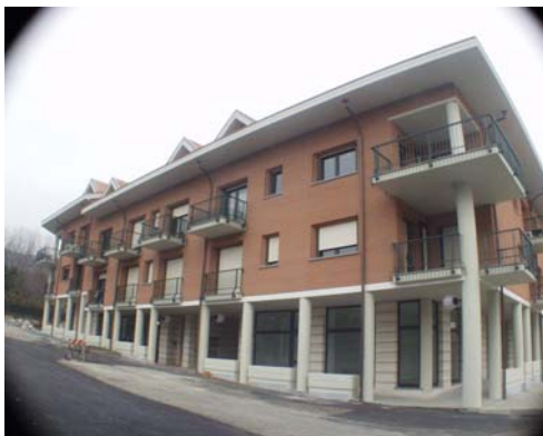
Fabbricato commerciale e residenziale, in San Secondo di Pinerolo (TO)