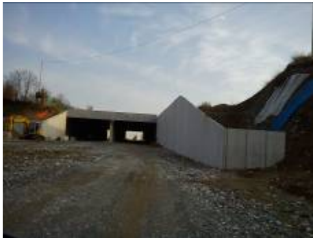
Collegno, località Viale Certosa