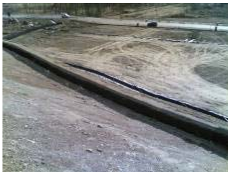
Avigliana, località ex cava Sada