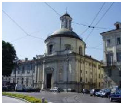
Chiesa "Santa Croce" sita in Torino